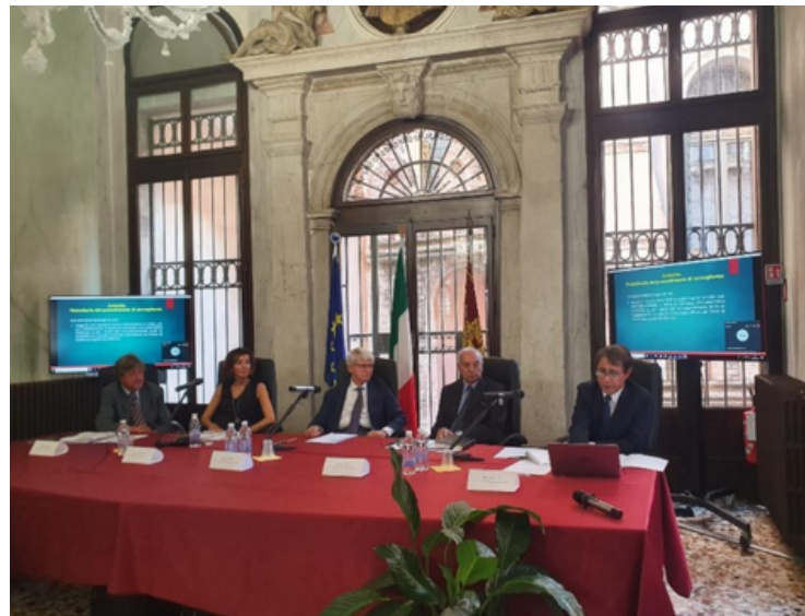
Masa Rotundă Națională Italia, Veneția 29 Septembrie 2023

În total, la evenimente au participat 75 de practicieni din domeniul judiciar.