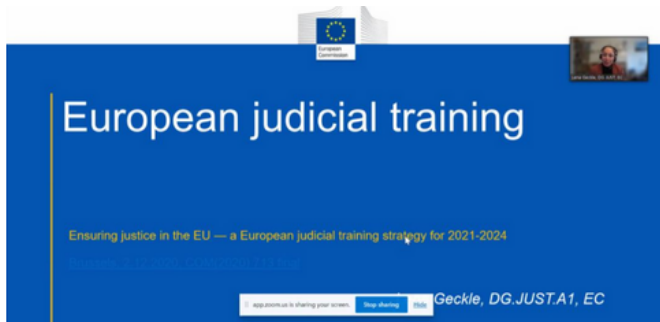
Reprezentant al European Judicial Training Unit, a prezentat nucleul Comisiei Europene (CE).

În acest sens, un alt punct interesant care a ieșit în evidență în cadrul IVC se referă tocmai la necesitatea de a avea contact direct cu partenerii străini. Speakerii din Belgia, Germania, Olanda și Polonia au subliniat relevanța contactului direct, adică întâlnirea colegilor străini pentru a discuta,