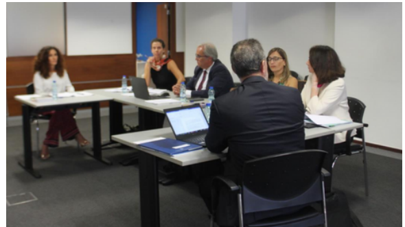
Masa Rotundă Națională, Portugalia, Lisabona 10 Octombrie 2023