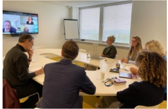
Masa Rotundă Națională, Țările de Jos, Utrecht 23 Octombrie 2023

Practicienii italieni s-au concentrat pe necesitatea de a dota adecvat profesioniștii cu modul de implementare a FD, instrumentele și agențiile disponibile care pot contribui la asistarea lucrului lor zilnic în ceea ce privește procedurile de transfer. Similar cazului francez, participanții la Masa Rotundă Italiană au subliniat rolul pe care comunicarea, între profesioniști și statele membre, o poate avea în avansarea unei aplicări fluide a instrumentului legal .