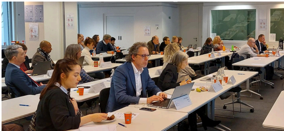
Sesiunea plenară finală

În sfârșit, în ceea ce privește utilizarea mijloacelor digitale pentru promovarea instrumentului UE, practicienii au pledat cu promptitudine pentru utilitatea newsletterelor destinate judecătorilor, magistraților, procurorilor, avocaților, ofițerilor de probațiune și experților judiciari cheie. La un nivel mai larg, o idee interesantă se referă la utilizarea instrumentelor AI pentru a actualiza intranetul birourilor judiciare, dar și pentru a crea o platformă sau un forum în care experții în domeniu să poată pune și răspunde la întrebări, să contacteze direct colegul străin și să distribuie cele mai bune practici.