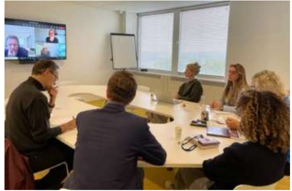
De Nederlandse rondetafelbijeenkomst, gehouden in Utrecht op 23 oktober 2023

De Italiaanse deelnemers gingen in op de noodzaak om beroepskrachten adequaate te informeren hoe het KB geïmplementeerd dient te worden en welke instrumenten en instanties hen kunnen ondersteunen bij overdrachtsprocedures. Net als in Frankrijk benadrukten de deelnemers aan de Italiaanse Rondetafelbijeenkomst de rol die communicatie, in de keten en tussen lidstaten, kan spelen bij het bevorderen van een soepele toepassing van het juridische instrument .