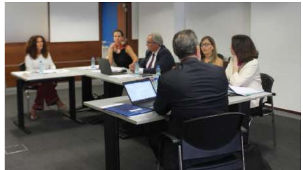
De Portugese rondetafelbijeenkomst, gehouden in Lissabon op 10 oktober 2023