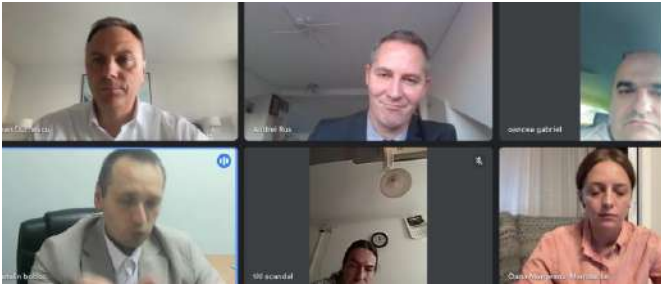
De Roemeense rondetafelbijeenkomst, online gehouden op 16 oktober 2023