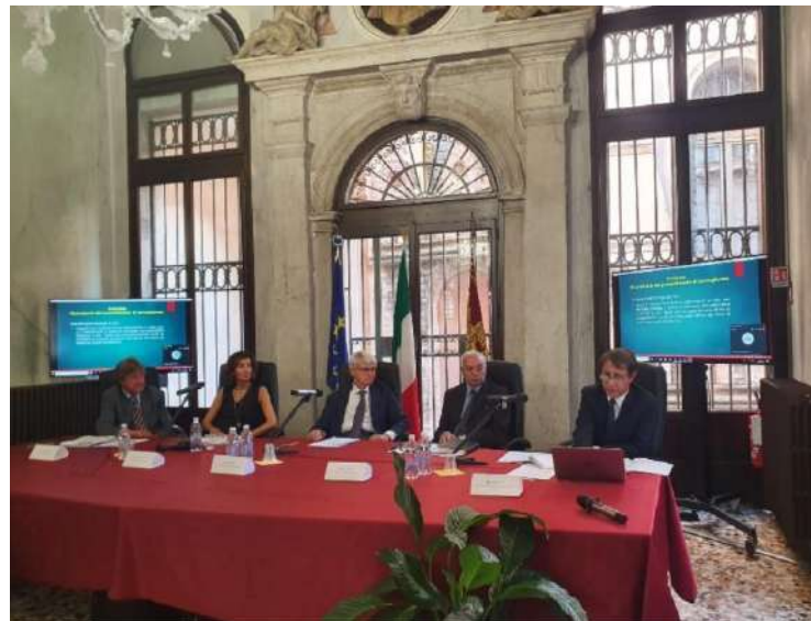
De Italiaanse rondetafelbijeenkomst, gehouden in Venetië op 29 september 2023

In totaal woonden 75 beroepskrachten uit de strafrechtsector deze evenementen bij.